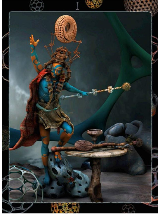
마술사, 머레이 크루거, 2011년 작

(캘리포니아주 산타아나) - 7월 1일 개장하여 2023년 11월 1일까지 운영되는 존 웨인 공항 비 스미스 갤러리에서 라구나 페스티벌 오브 아트의 영구 컬렉션 중 최고의 작품들을 전시합니다.